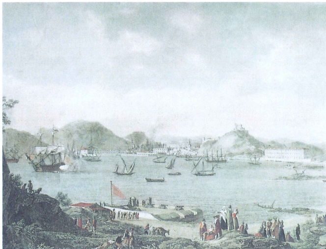
Litografía que muestra una panorámica del puerto de Cartagena en el siglo XVIII.

La ciudad de Cartagena también fue remodelada y adquirió gran importancia al ser titulada sede de la Capitania de la Armada y construirse en ella el Arsenal.